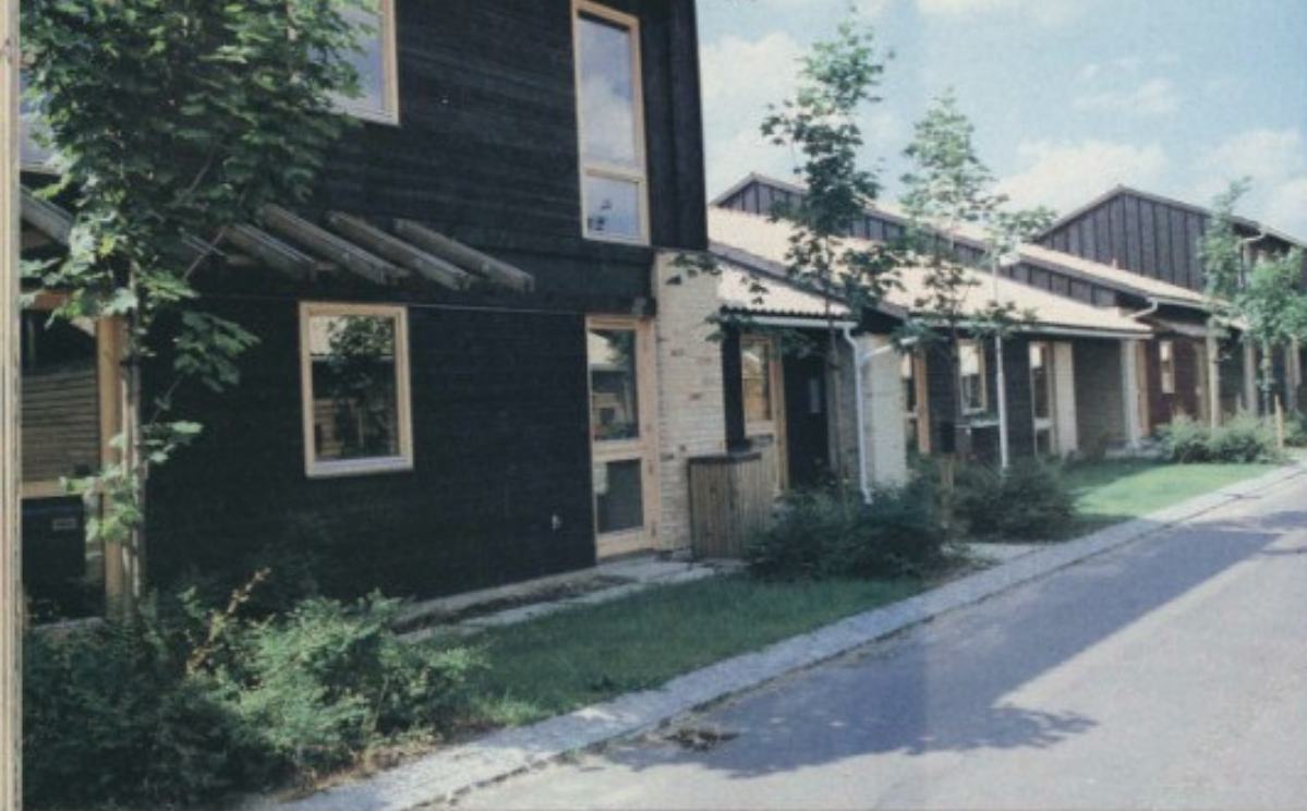
Ullerødhave er en spændende form for rækkehus-bebyggelse med huse både i én og halvanden etage. Alle huse har gule tegltage, mens træfacaderne er sorte, røde eller grønne.