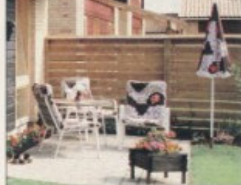
Til hvert hus er der en dejlig lille privat have med terrasse.